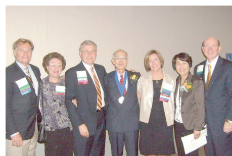
学会主要関係者との記念撮影